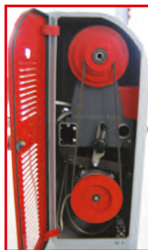
stabiler Riemenantrieb solid and smooth belt run

umfangreiches Drechselzubehör ab Seite 124 various turning accessories from page 124